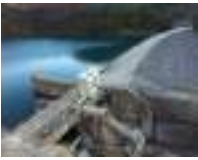
Barrage de Gréoux

Montmeyan Plage → Village d'Esparron : 9 Km Village d'Esparron → Barrage de Gréoux : 5 Km