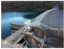
Barrage de Gréoux

Montmeyan Plage → Village d'Esparron : 9 Km Village d'Esparron → Barrage de Gréoux : 5 Km