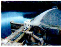
Barrage de Gréoux

Montmeyan Plage → Village d'Esparron : 9 Km Village d'Esparron → Barrage de Gréoux : 5 Km